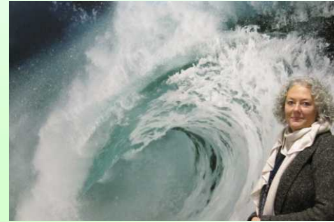
Hier kommt was in Bewegung

„Alles, woran man glaubt, beginnt zu existieren.“ Ilse Aichinger